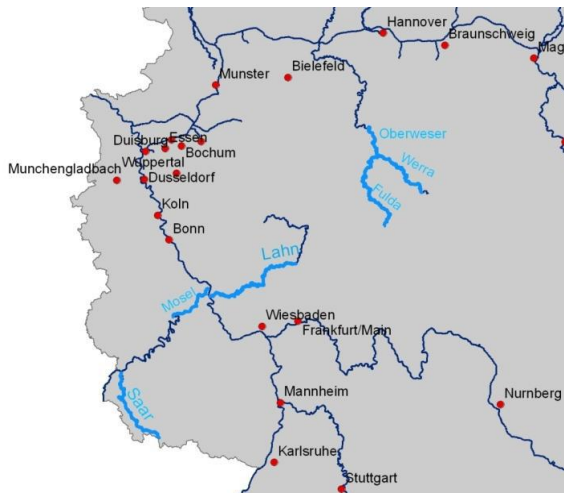
Abbildung 1: 1D-Modelle für Bundeswasserstraßen

Im Rahmen ihrer Aufgaben erstellt, pflegt und betreibt die Bundesanstalt für Gewässerkunde 1D-Modelle der Bundeswasserstraßen auf Basis der Simulationssoftware SOBEK. Während für die Mosel und für die Lahn bereits Modelle existieren, die zu aktualisieren sind, werden im Rahmen des Projektes neue Modelle für die Fulda, Werra und Oberweser sowie für die Saar erstellt und kalibriert. Insgesamt umfassen die Modelle ca. 490 Fluss-km und haben grundsätzlich den Anforderungen der gewässerkundlichen Ist-Beschreibung, der operationellen Wasserstandsvorhersage und von prognostischen Untersuchungen zur Abflusssimulation zu genügen.